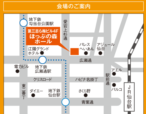
●地下鉄広瀬通駅東2出口より徒歩約3分 ●JR仙台駅西口より徒歩約10分