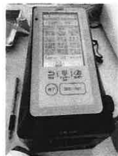
KP-30 ACアダプタ専用タイプ