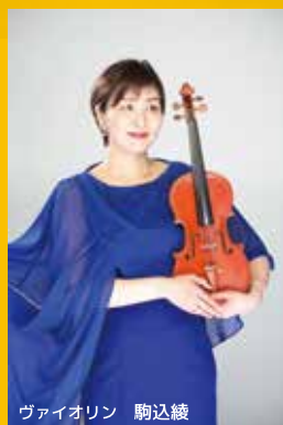
ヴァイオリン 駒込綾