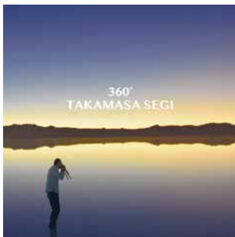
「360°」(スリーシクスティ) 2020年5月20日発売 3,000円(税込) 発売) Pony Canyon Inc.