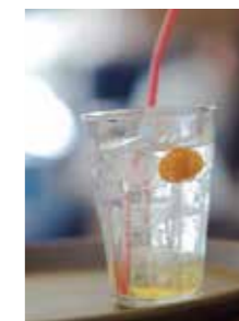
きんかんハニーソーダ