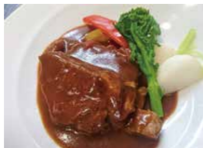
①やわらかポークシチュー

お好きな料理を 5種・8種・12種詰め合わせ ①〜④商品代 + 送料(クール)、保冷バック込み 1,000円 (5種、東北、関東へお届けの場合)