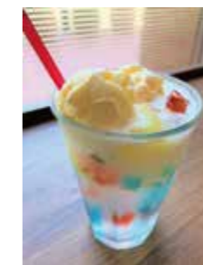
きらきらスカッシュ