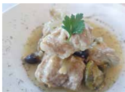
③鶏肉のカチャトーラ