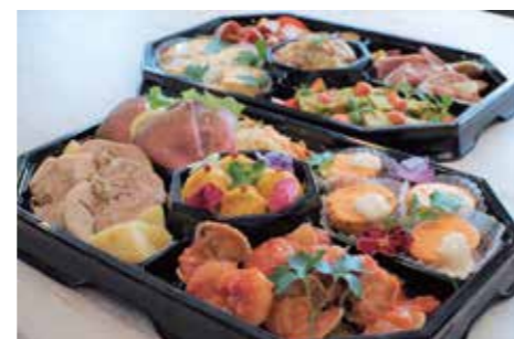
オードブル 5,000円(4人分)

オードブル 1,500円(1人分) / 2,600円(2人分) / 5,000円(4人分)