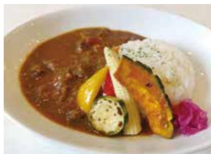
④コトコト煮込んだ牛スジカレー