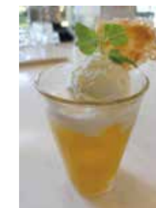
オレンジフロート