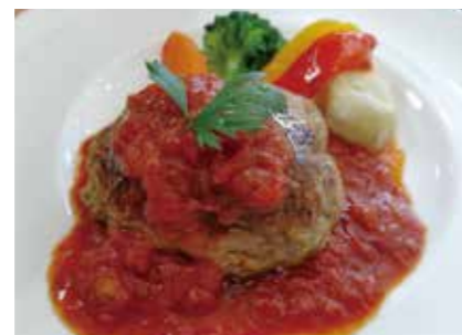
②自家製ハンバーグ